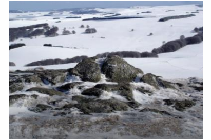
L'Aubrac, pôle nordique

Objectif 3.3 : Conforter le développement des activités de pleine nature sur les pôles touristiques de Saint-Urcize et Lanau/Sarrans.