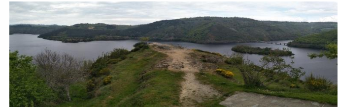
Panorama depuis le belvédère de Mallet

AXE 3 - UNE POLITIQUE TOURISTIQUE ATTRACTIVE, APPUYÉE SUR UNE RICHESSE NATURELLE, PATRIMONIALE ET CULTURELLE EXCEPTIONNELLE