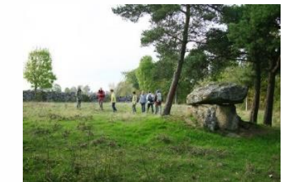
Mégalithe de Saint-Flour Communauté