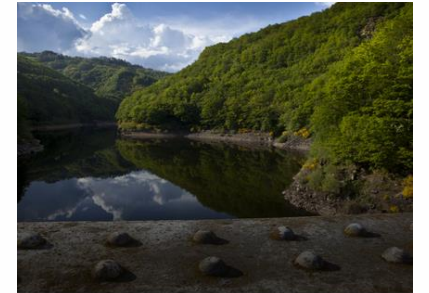
Plan d'eau de Lanau