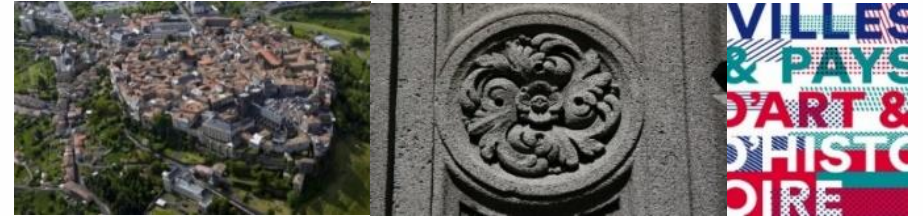
Saint-Flour, pays d'art et d'histoire et le label

Objectif 3.5 : Préserver la dimension patrimoniale du territoire, qu'elle soit naturelle ou culturelle, avec ses sites phares, ses valeurs, son identité.