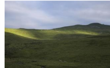
Plomb du Cantal, point culminant du massif Cantalien

AXE 3 - UNE POLITIQUE TOURISTIQUE ATTRACTIVE, APPUYÉE SUR UNE RICHESSE NATURELLE, PATRIMONIALE ET CULTURELLE EXCEPTIONNELLE