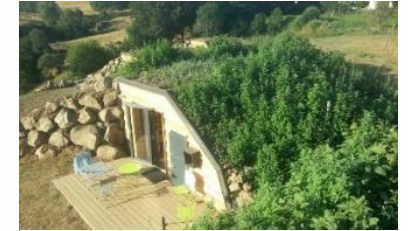
Camping de Saint-Urcize

Objectif 3.6 : Accompagner le développement d'une offre touristique misant sur « l'excellence environnementale » .