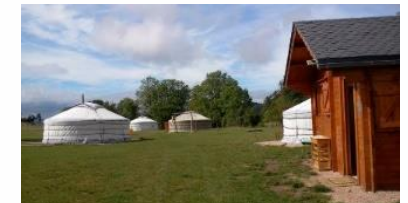
Camping insolite "Au près des yourtes"