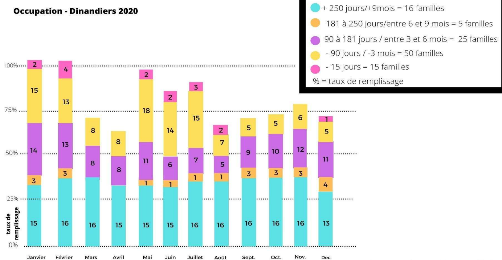
Occupation - Dinandiers 2020

Source : système de télé-gestion EELIS Document réalisé par Ema SIGNORET, FDGS ©