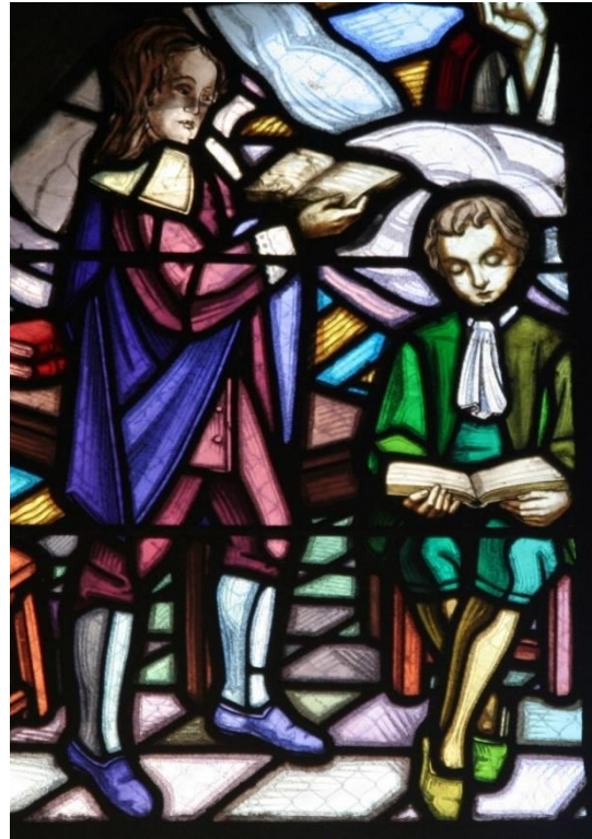
Eglise Saint-Martin et Saint-Blaise de Chaudes-Aigues